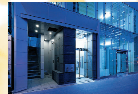
フォーラムビル(クローバー青山・ONE)