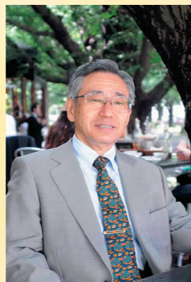
「経営フォーラム」塾長

——お客様と共に様々な問題に対する解決策を練る。「困った時に側にいる」経営の備えとして安心感を得られる外部ブレーンとして、青山ビジネスフォーラムは常に皆様の力強いパートナーでありたいと思っています。